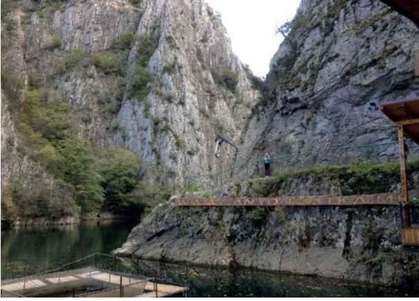
Makta şelâlesinden bir görünüm

Üsküp'te Hristiyanların yaşadığı Vardar nehri-nin karşı tarafına geçtiğimizde, son derece gelişmiş, modern bir şehirle karşılaştık. Müslümanların oturduğu kesim tamamen geri bırakılmış ve kendi kaderine terk edilmişti. Öyle anlaşıyor ki Üsküp ve Makedonya'nın gelir kaynakları bu ülkede yaşayanlar arasında eşit paylaştırılmıyor ve Hristiyanlar lehine şehirleşme yaşıyordu. Hristiyanların yaşadığı Üsküp kesimi yüksek apartmanlar, modern çarşılar, AVM merkezleri, düzenli cadde ve sokaklarla, ayrımcılığın olduğunu gözler önüne sermekte ve Müslümanların geri bırakıldığını çok açık görmektesiniz. Makedonya'nın başkenti Üsküp'ün yakınlarında, Vodno Dağı'nda 2002 yılında yapılan Milenyum Haçı, Müslümanlar ile gayri müslimler arasında çok açık kültür savaşını göstermektedir. Hristiyanlığın 2000 yılı için yapılan 66 metre yüksekliğindeki bu haç çıplak gözle şehrin her tarafından çok rahat görülmektedir. Hristiyan Üsküp idarecilerinin dağa inşâ ettikleri haçı görmek ve inançlarının gereğini yerine getirmek için teleferikle, Vodno Dağı'na çıkıldığını öğreniyoruz.