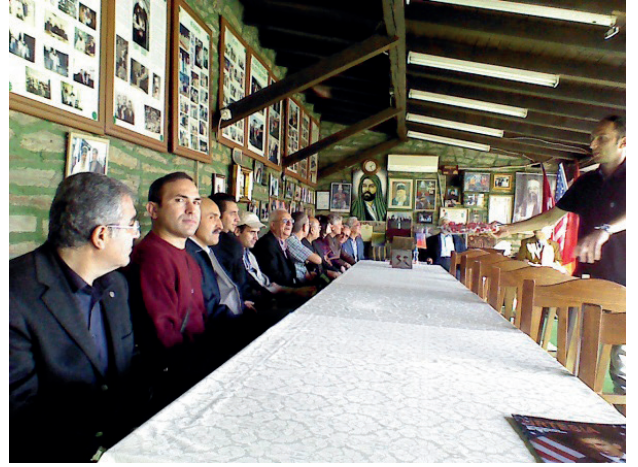
Bektâşî Harâbâti Baba Dergâhı'nda sempozyuma katılanlar

Makedonya'nın kuzey-batısında yer alan ve Üsküp'e 40 km.(veya 38 km.) uzakta olan Kalkandelen şehrinin sınırları içinde Bektâşî Harâbâti Baba Dergâhı (Sersem Ali Baba Dergâhı/ Server Ali Baba Dergâhı) ) Osmanlı kültür mirası bakımından önemlidir. Dağ eteğine yakın ve yeşil bir bahçe içerisine inşa edilen dergâhta Alevî-Bektâşî-Sünnî motiflerini çok rahat görebilirsiniz. Dergâh binası dışında, bahçede şeyhin ve müridlerinin dinlenmesi için yapılmış çitlerle çevrili mekân vardı ve burada "yâ müfettiha'l-ebvâb iftah lenâ hayra'l-bâb" hadis-i şerifi "yazılmıştı.