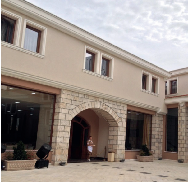
Bushı Resort Otel i lokantasının giriş kapısı