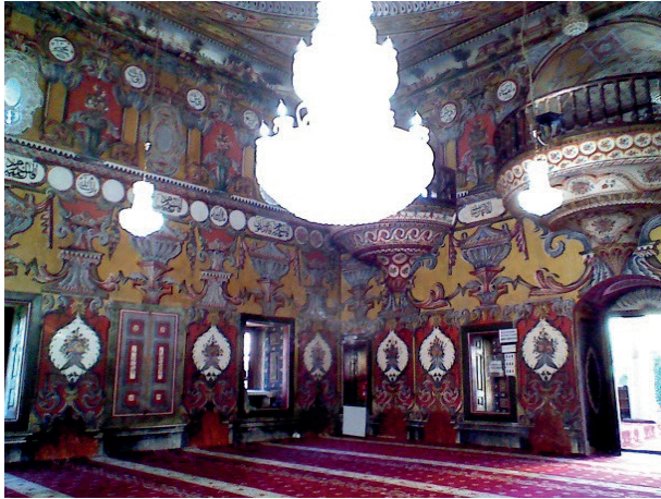
Kalkandelen'de Alaca Camii iç görünüşü

Makedonya'nın kuzey-batısında yer alan ve Üsküp'e 40 km.(veya 38 km.) uzakta olan Kalkandelen şehrinin sınırları içinde Bektâşî Harâbâti Baba Dergâhı (Sersem Ali Baba Dergâhı/ Server Ali Baba Dergâhı) ) Osmanlı kültür mirası bakımından önemlidir. Dağ eteğine yakın ve yeşil bir bahçe içerisine inşa edilen dergâhta Alevî-Bektâşî-Sünnî motiflerini çok rahat görebilirsiniz. Dergâh binası dışında, bahçede şeyhin ve müridlerinin dinlenmesi için yapılmış çitlerle çevrili mekân vardı ve burada "yâ müfettiha'l-ebvâb iftah lenâ hayra'l-bâb" hadis-i şerifi "yazılmıştı.