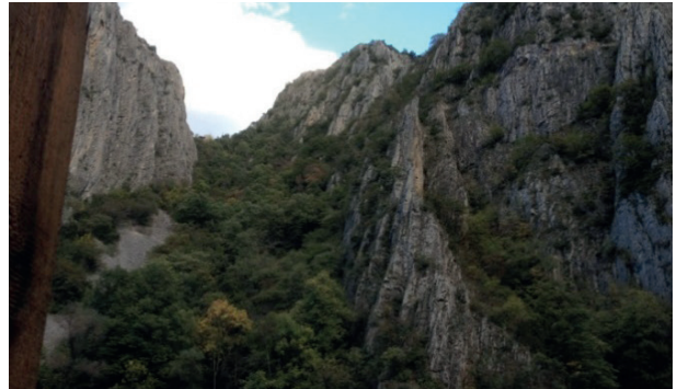
Matka tepesinden bir görünüm