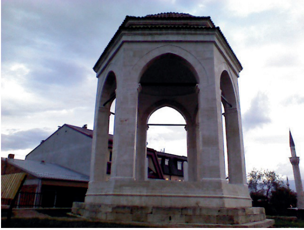
Üsküp Fâtîhi İshak Bey'in türbesi

tırmış olduğu caminin yanında bulunan mermer türbenin ona ait olduğu tahmin edilmektedir. (5) (Emecen 2000: 524-525) 1438 tarihinde ibadete açılan caminin, medresesi, hamamı ve bir de zaviyesi bulunmaktadır. Caminin duvarları alacalı, çiçek motifleri ile süslü olduğundan, halk arasında Alaca Camiî denilmektedir. 1943 yılında, Üsküp bombalandığında cami ibadet için kullanılmaz hale gelmişti. 1961 yılına kadar ayakta duran minaresi ise dönemin idarecileri tarafından yıktırılmıştı (Resim,15). Cami avlusunda Paşa Yiğit Bey (Meddah Babab)'in türbesi, medrese ve zaviye de bulunmaktaydı. Medrese İkinci Dünya Savaşı'ndan sonra kapatılmıştır. Bu tarihi eserlerden Paşa Yiğit Bey'in türbesi, Meddah Baba'nın mezarı, kütüphane, mescit ve şadırvan bulunan "Yiğit Paşa Kültür Merkezi", Bursa Büyükşehir Belediyesi destekleri ve Çayır Belediyesi ile Enka Holding'in katkılarıyla, 1 Temmuz 2016 tarihinde resmi törenle yeniden ziyarete açılmıştır.