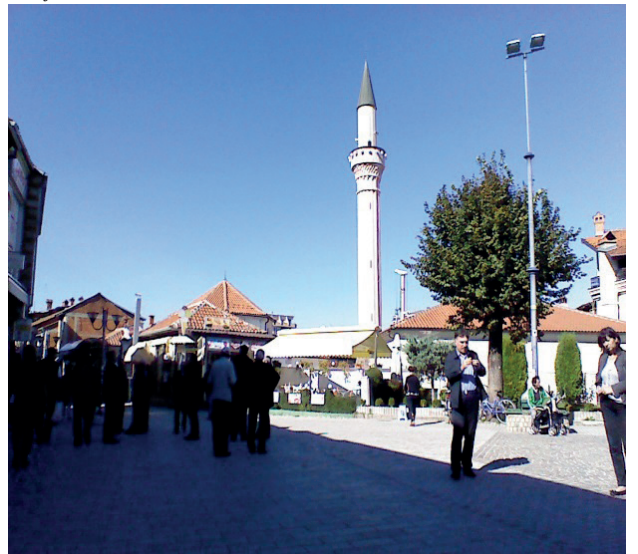
Ohri'de Zeynel Abidin Paşa Camii ve tekkesi

Makedonya'nın güney-batısında bulunan Ohri (Ohrid) ziyaret edeceğimiz son şehirdi. (17) Müslümanların sayılarının bir hayli azaldığı şehir, Ortodoks Makedonların dini merkezi ve ülkenin dünyaca ünlü turistik beldesidir. Ohri'li Türklerden ekonomik nedenlerden dolayı Batılı ülkelere göç edenler olmuş, ayrıca önemli bir kısmı Türkiye'ye yerleşmişlerdir. (18) Tüm bunlara rağmen tarihi eserler ve yapılaşma özellikleri ile hâlâ Osmanlı özelliklerini yansıtmaktadır. Bu durumu yakından görmek isteyen katılımcılar, Ohri çarşısını gezdikten ve alış-veriş yaptıktan sonra, adeta uçsuz-bucaksız Ohri Gölü'nü temaşaya daldılar. Ohri'den dönen sempozyum katılanları, aynı gün Üsküp'e gelerek, en güzel anılarla Türkiye'ye dönme yolculuğuna başladılar.