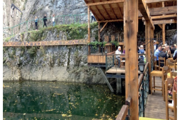
Matka'da çay bahçesinden görünüm

Sempozyumun saat 13.00'de bitiminden sonra öğle yemeğini yemek ve Matka (Baraj Gölü) ile Üsküp'ün bazı yerlerini ziyaret etmek için iki dolmuş ile yola çıktık. Yol üzerinde küçük bir lokantada yenilen öğle yemeğinden sonra, Matka'ya hareket ettik. Üsküp'ten yaklaşık 20 km.uzaklıkta dağlık ormanlık bir alan olan Matka ve Treska nehri yatağında kurulan baraj gölü (Hidrosantral mevcut) adeta bir cenneti andırmaktadır. Bu doğal güzelliği seyretmek ve bu tabiat hârikası ortamda vakit geçirmek için özel arabalarla gelen aileler yanında, gruplar halinde otobüs ve minibüslerle gelen ziyaretçiler de oldukça fazlaydı. Taşıtların Matka'nın giriş kısmında bırakılması ile yaya yürüyüşe başlayan ziyaretçiler, dağ eteğinden ve yerine göre küçük tünel gibi geçiş yerlerinden geçtikçe fotoğraf çekiyor ve poz vererek fotoğraf çektmekten kendilerini alamıyorlardı. Dağın arasından akan nehir suyu için baraj gölü oluşturulmuş ve gölün üst tarafına tamamen ahşap bir dinlenme bahçesi tesis edilmişti. Turistik malzemelerin satıldığı bahçede çay ve dinlenme molası verdikten sonra, Üsküp'ün önemli yerlerini görmek için tekrar şehre döndük.