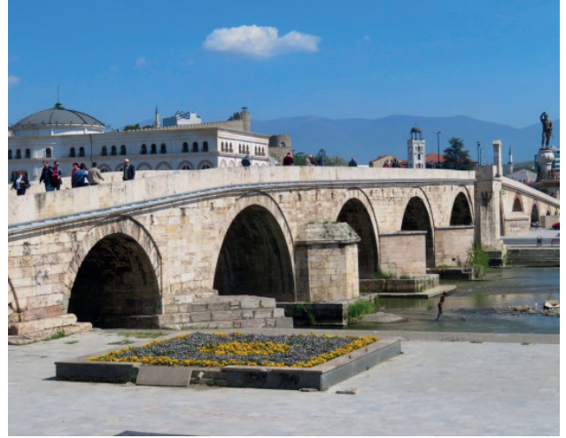
Vardar Nehri ve Taş Köprü

ile batı yakasından ikiye bölen Vardar Nehri üzerinde inşa edilmiştir. Osmanlı Arşiv belgelerinde köprünün adının, Fatih Sultan Mehmet Köprüsü olarak geçmesine rağmen halk arasında Vardar Köprüsü veya Taş Köprü isimleriyle anılmaktadır. Kaynaklarda köprünün inşaatına 1444 yılında Sultan II. Murat döneminde başlandığı ve 1456'da Fatih Sultan Mehmet döneminde tamamlandığı belirtilmektedir. 13 kemer gözlü olan köprünün uzunluğu toplam 220 metreyi, genişliği de 6 metreyi bulmaktadır. (15)