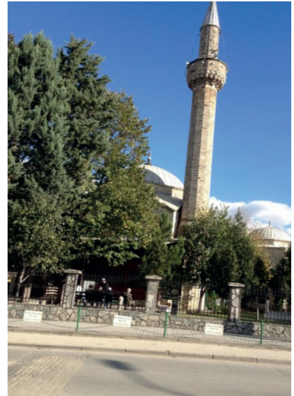
Mustafa Paşa Camii'nin görünümü

Mustafa Paşa Câmîî (1491-1492), Üsküp'teki en güzel İslâmî eserlerden birisidir. Üsküp Kalesi'nin doğu eteklerinde 15. yüzyılda inşa edilmiş olan Mustafa Paşa Camii, Osmanlı dönemine ait eserlerin en görkemlilerindendir. 1492 yılında Sultan II. Bayezid ve Yavuz Sultan Selim dönemlerinde vezirlik yapan Mustafa Paşa tarafından yaptırılmıştır. Câmînin son derece mükemmel ve sade bir mimârî yapısı vardır. Kare planlı tek kubbeli camide, kubbe ağırlığı payandalar vasıtasıyla duvarlara verilmiştir. 1963 depreminden sonra Mustafa Paşa Camii'nde çok ciddi hasarlar oluşmuştu. O dönemde yapılan onarım çalışmalarının ardından ancak 1968 yılında yeniden ibadete açılmıştı. Fakat restorasyonun aslına uygun şekilde olmaması ve camiye zarar vermiş olması daha kapsamlı bir onarım ve güçlendirme çalışmasını zorunlu hale getirmişti. Caminin restorasyonu ve çevre düzenleme projesi, Kültür ve Turizm Bakanlığı, Diyanet İşleri Başkanlığı ve Tika işbirliğinde 2007 yılında başlatılmış ve 2008 yılında caminin restorasyonu çerçevesinde minare, beden duvarı, kubbe ve temel güçlendirme çalışmaları tamamlanmıştır. Restorasyon kapsamında çevre düzenlenmesi, sıhhi-mekanik-elektrik tesisatları, kalem işi süslemeler ve diğer çalışmaların ise 2009 yılında tamamlanması kararı alınmıştı. Projenin tamamlanması 2009 yılında bitirilecek denmesine rağmen cami giriş kapısının üstündeki yazıda ancak 2011 yılında bitirildiği anlaşılmaktadır. (3)