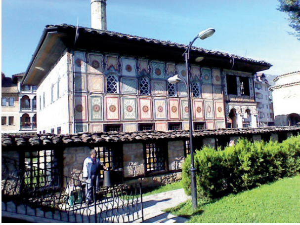
Kalkandelen'de Alaca Camii'nin dış görünüşü

bütün tonları ile mükemmel bir süsleme sanatını ve yazı sanatını cami içinde gördüğünüzde kendinizi son derece etkileyen bir eserle karşı karşıya olduğunuzu anlarsınız. Cami ziyaretinden sonra bahçe içinde bulunan Kur'an Kursu binasında çaylarımızı içtik ve yolumuza koyulduk.