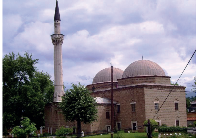
Üsküp İsa Bey Camii

Sultan Murad Camiî'nden kuzeye doğru iniyor ve İsa Bey Camiî'ni ziyarete geliyoruz. Camiî, 1475 yılında İsa Bey tarafından Üsküp'te inşa edilmiştir. İsa Bey Üsküp'ün fethinde önemli rol oynayan İshak Bey'in oğludur. İsa Bey türbesi için 2014 yılı Nisan ayında çevre düzenlemesi yapılmış ve bugünkü durumuna getirilmiştir