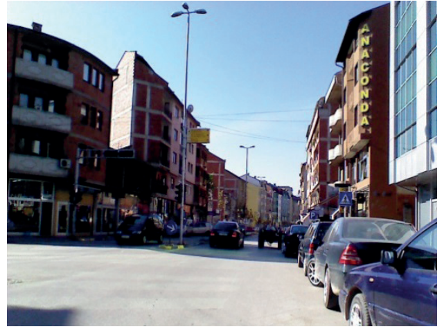
Kalkandelen'den bir görünüm

Bugün (19 Ekim 2014 Pazar günü) Kalkandelen'e ve Ohri'ye gidecektik. Bunun için iki dolmuş ile yola çıktık ve önce Kalkandelen şehrine vardık. Balkanlar'daki önemli bir Osmanlı şehri olan Kalkandelen Makedonya'nın kuzeybatısında yer alan Şar Dağları'nın eteğinde, Pena nehri kenarında kurulmuştur. Başkent Üsküp ve Manastır'dan sonra Makedonya'nın üçüncü büyük şehridir.