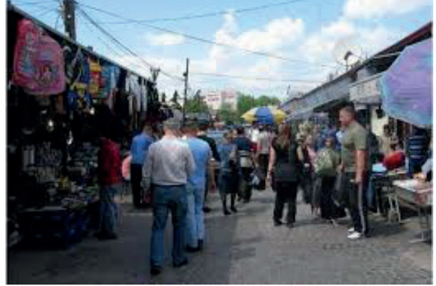
Üsküp Bit Pazarı

da oldukça fazla lokantaları ve pastaneleri görmek mümkündür. Çarşının ara geçiş yerleri oldukça dar olduğundan sık sık izdiham yaşanmaktadır.